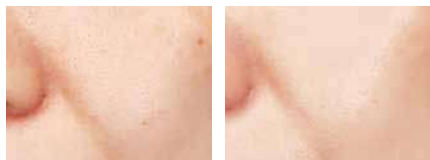
素肌 プライマー塗布