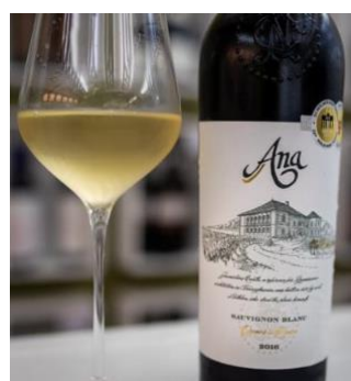
【ルーマニアワイン、アナ】