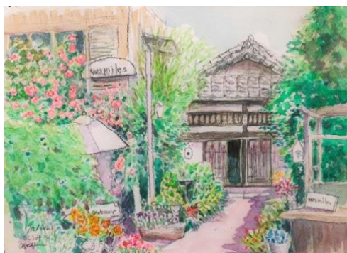
【古民家カフェ ころみ】